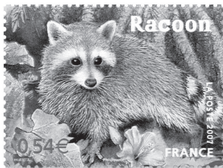
Figure 3. — Le timbre du Racoon (Raton laveur de la Guadeloupe) émis en avril 2007 par la Poste française.

En avril 2007, la Poste française a émis une série de timbres consacrée aux espèces protégées d'Outre-Mer et le Raton laveur de la Guadeloupe, sous son appellation locale de « Racoon », a été l'une des espèces choisies (Fig. 3). Les mesures réglementaires, comme l'image officielle donnée à cet animal, devraient être reconsidérées en prenant en compte le fait qu'il s'agit sans équivoque d'une espèce introduite et abondante dans sa très vaste aire de répartition initiale. Si l'Agouti doré, du fait de son introduction très ancienne et de son actuelle rareté en Guadeloupe, constitue un cas particulier qui peut justifier son statut actuel, il nous semble qu'il serait également nécessaire de reconsidérer le statut de l'Opossum commun Didelphis marsupialis à la Martinique, intégralement protégé sous cette dénomination par un autre arrêté du 17 février 1989.