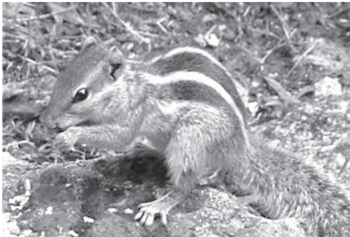
Figure 1. — Funambulus pennantii (morne Fleuri, mai 2007). La présence d'une raie claire entre le flanc et la première raie foncée est l'une des caractéristiques le plus directement apparente de cette espèce de funambule.

Si Wroughton (1905, 1916), suivi par Moore & Tate (1965), a distingué trois sous-espèces ( pennantii , argentescens et lutescens ), au sein de F. pennantii , sur la base de la coloration dorsale, la validité de ces sous-espèces a été controversée (e.g. Agrawal & Chakraborty, 1979),